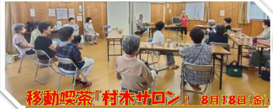
移動喫茶「村木サロン」 8月18日(金)

「一人で歌集を買ってきて歌っているけれど、淋しくて」と言われた言葉にじくんと来ました。「コロナで大好きな歌を歌うことをがまんし、人に会うことも遠ざかってしまった三年間。寂しすぎますね。伴奏してくださる方も相敬して、十月から始められたら・・・」と思っています。来月号の通信でご案内しますね。