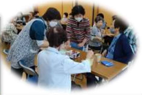
5月19日の様子 久しぶりの会話が弾むのね♪

<ほっとサロン9月の予定> (喫茶は10時～12時まで) (当番、喫茶・おとしごろのみですが、感染拡大の場合は別途ご案内)